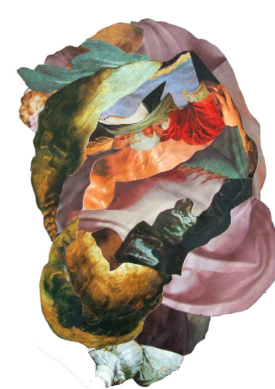
Theres Berner - o.T.